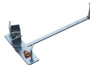
1. Nivelačná sada (pre prípravu vrstvy malty pod prvým radom)

Nástroje na miešanie a spracovanie maltovej zmesi musia byť čisté! Namiešanú maltu je nutné chrániť od rôznych nečistôt.