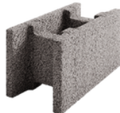
Durisol akustická tvarovka