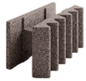
Durisol protihluková tvarovka